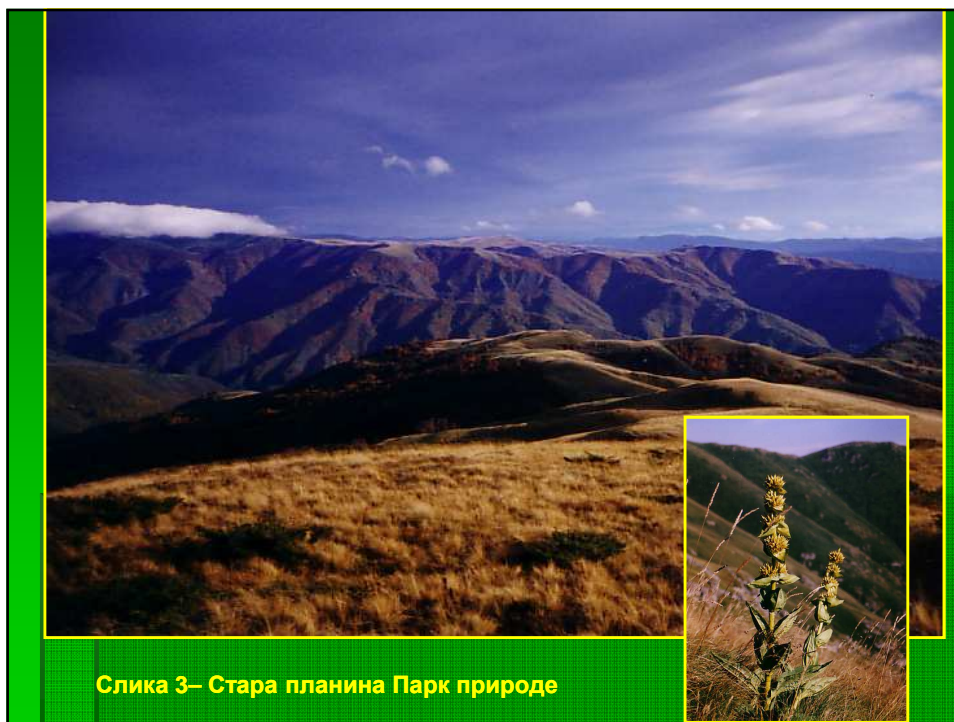
Слика 3— Стара планина Парк природе