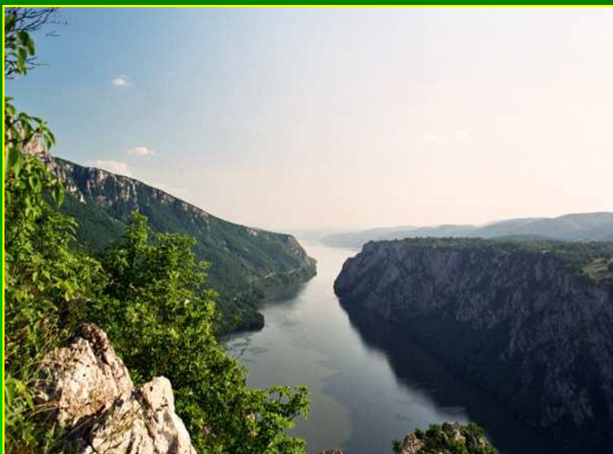
Слика 2 – Национални парк Ђердап