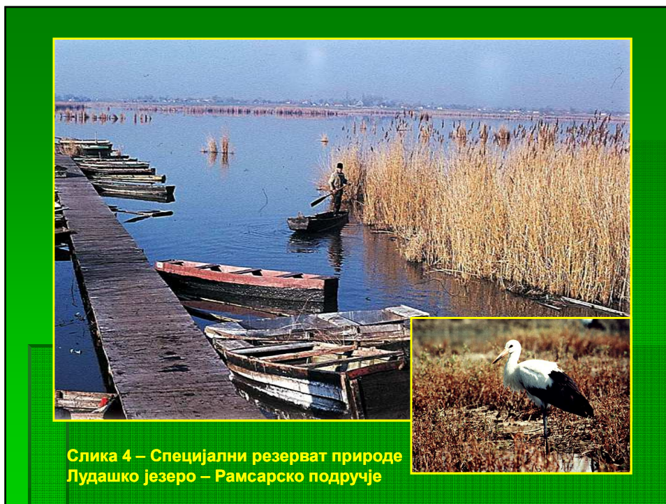
Слика 4 – Специјални резерват природе Лудашко језеро – Рамсарско подручје