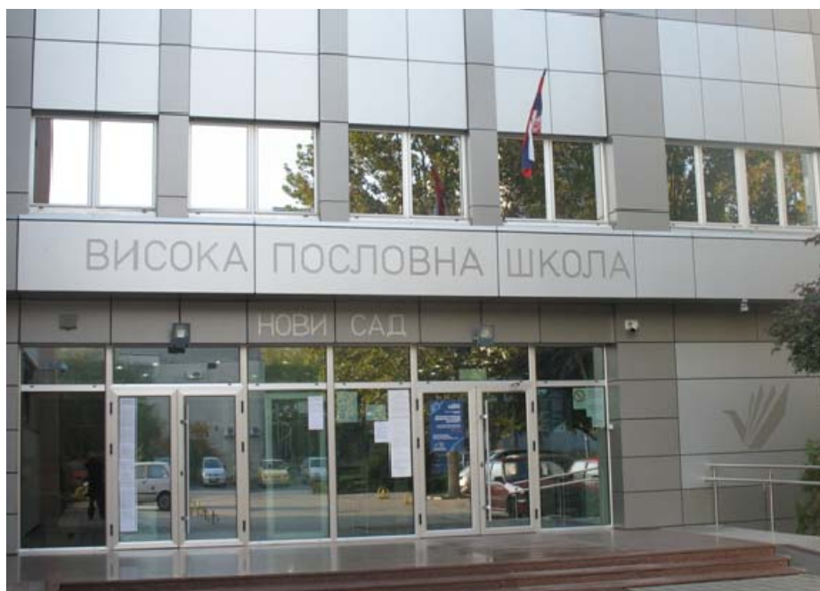
Зграда у улици Владимира Перића – Валтера бр.4.