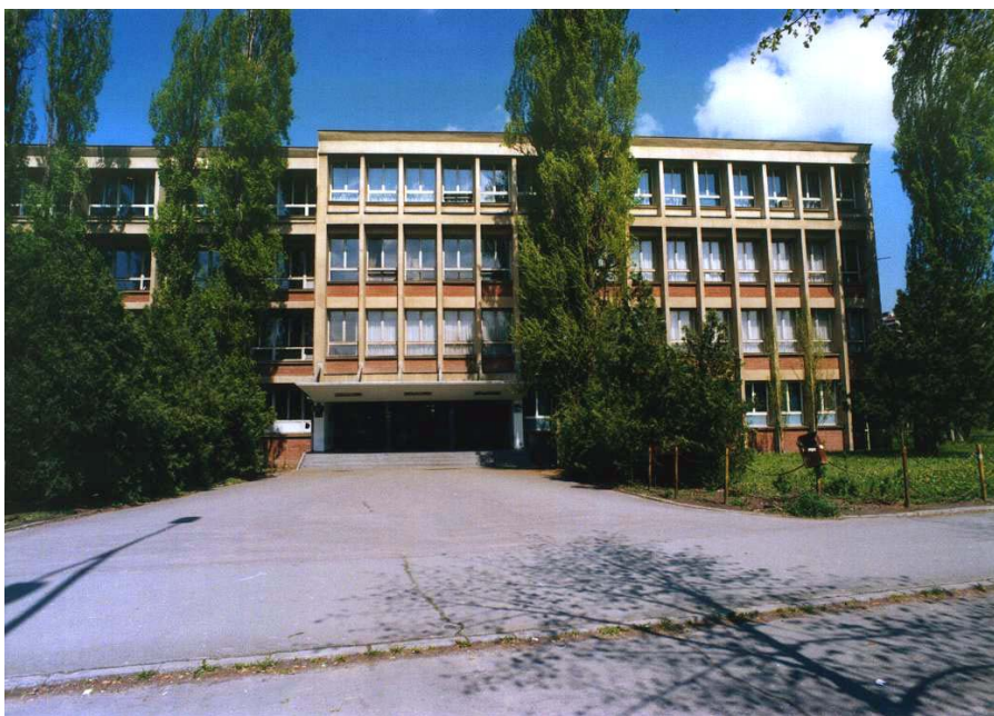
Зграда на Булевару Краља Петра I бр.38, III спрат