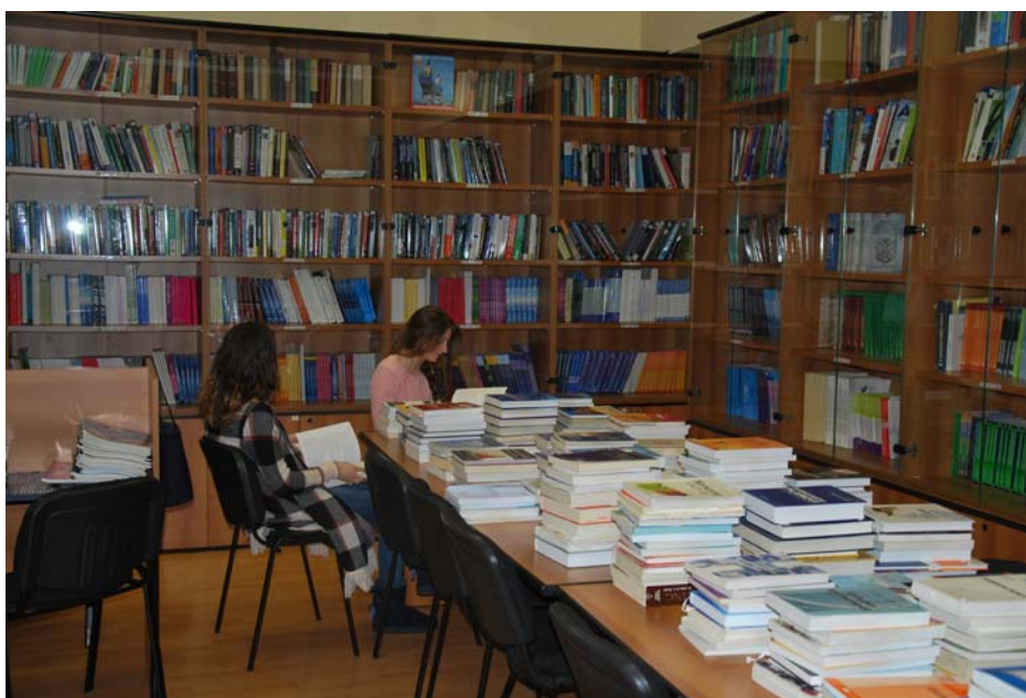
Једна од библиотека у Школи