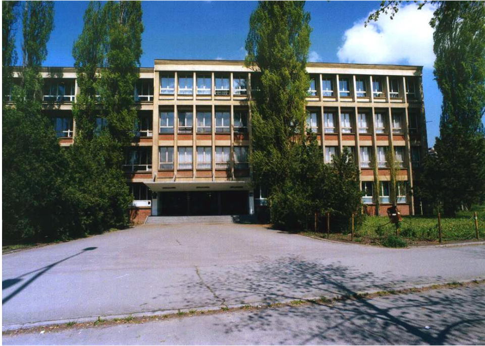
Зграда на Булевару Краља Петра I бр.38, III спрат