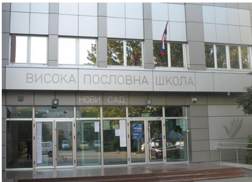
Зграда у улици Владимира Перића – Валтера бр.4.