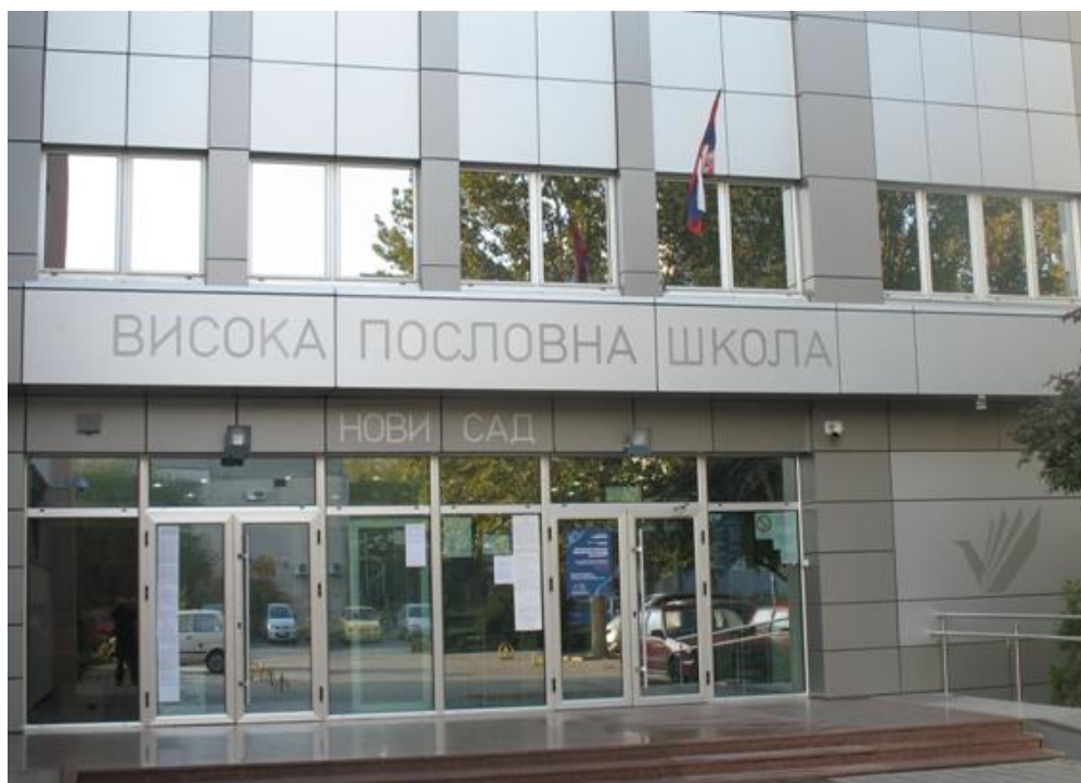
Зграда у улици Владимира Перића – Валтера бр.4.