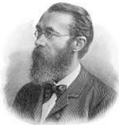
Slika 2. Vilhelm Vunt osnivač prve laboratorije za eksperimentalnu psihologiju

Psihologija postaje samostalna nauka osnivanjem laboratorije za eksperimentalnu psihologiju u Lajpcigu 1879. Nju je osnovao Vilhelm Vunt. On je eksperimentalno istraživao fenomene mentalnog života primenjujući postupke iz prirodnih nauka. Polovinom XIX veka, stvaraju se posebne psihološke discipline za izučavanje pojedinih grupa psihičkih pojava, pomoću kojih se psihologija razvija i obogaćuje osvajajući različite segmente duševnog života.