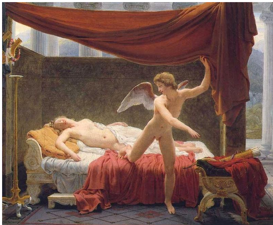
Slika 1. „L'Amour et Psyche” – Picot J.F, 1817, Luvr

Reč psihologija grčkog je porekla i u sebi sadrži reč psiha (duša) 1 . Pre navođenja istorijskih činjenica o razvoju discipline kada je reč o samom imenu korisno je da se ukratko podsetimo grčkog mita o Erosu i Psihi (Zamarovsky, 1985, str. 289–293) 2 . Psiha je bila lepa devojka čijoj se lepoti svako divio. Pošto je svojom lepotom pretela da će ugroziti Afroditu, samu boginju lepote i ljubavi, Afrodita je odlučila da joj se osveti tako što je zapovedila svom sinu Erosu da joj rani srce strelom ljubavi ne bi li se ona zaljubila u najružnijeg muškarca na svetu. Međutim, u tom pokušaju, Eros se ranio na svoju strelu i sam se zaljubio u nju. Kako bi se njihova ljubav ostvarila Psiha je obećala da nikad neće tražiti da vidi njegovo lice i da sazna ko je zapravo on, ipak u jednom momentu ona to obećanje krši. Zbog te izdaje njihova ljubav nailazi na prepreke, razdvajaju se, a Psiha dobija da savlada različite zadatke ukoliko želi da povрати izgubljeno. Na kraju, ipak uspeva i njih dvoje bivaju zajedno i dobijaju dete koje se zove Hedona.