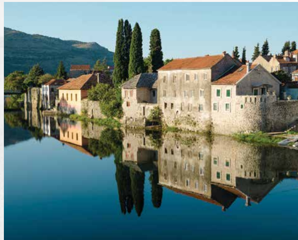
Trebinje, stari grad