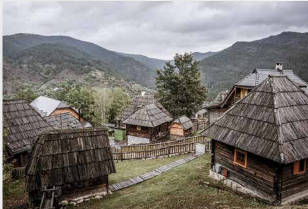
Drvengrad, Mečavnik, Mokra Gora