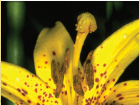
POLOVINA SLIKE UČITANA, GIF BEZ PREPLITANJA